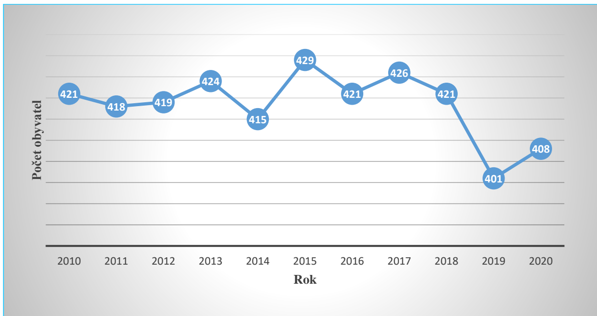
Graf 1 Vývoj celkového počtu obyvatel obce Vražkov v letech 2010 – 2020 (k 31. 12.)