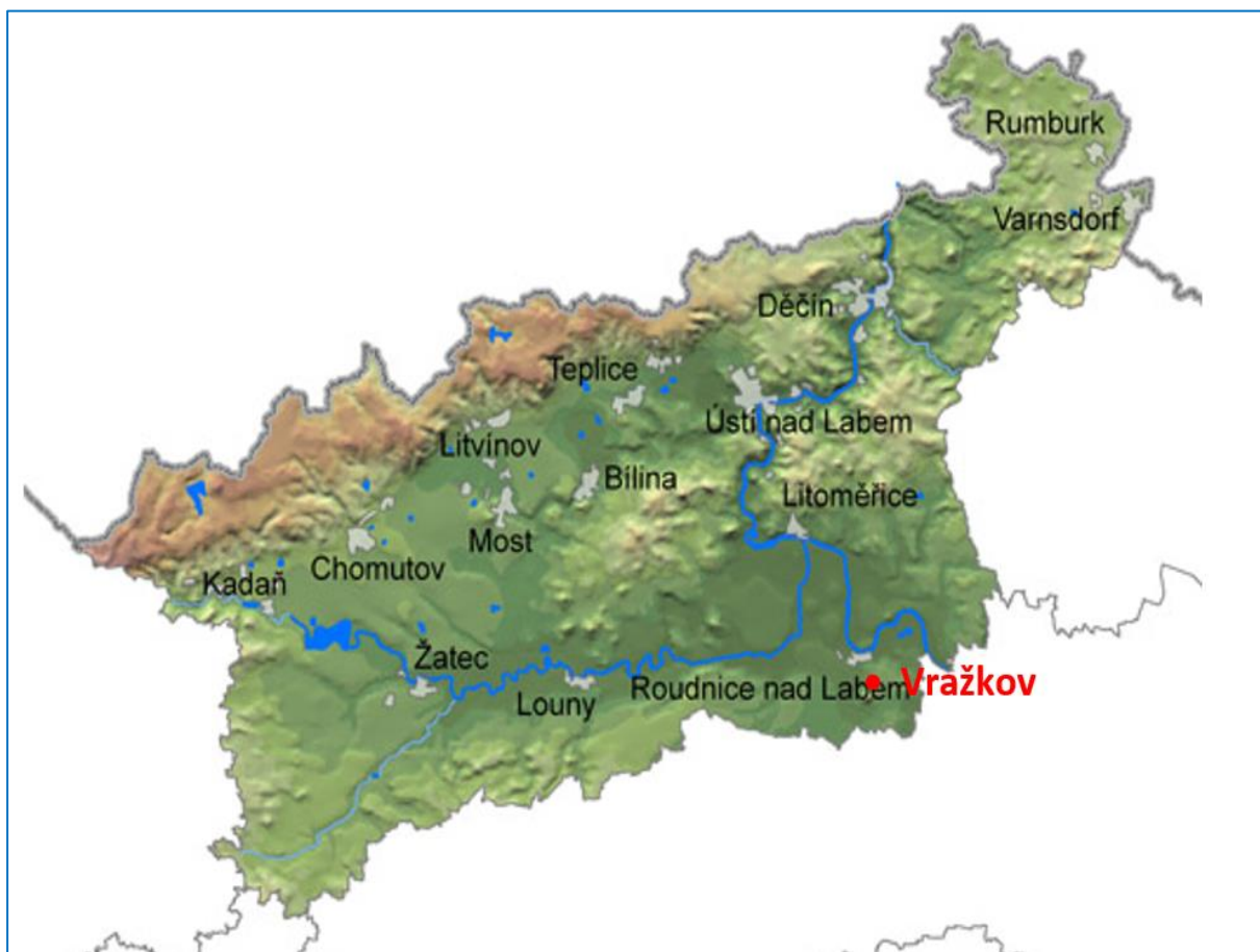
Obrázek 1 Obec Vražkov v rámci Ústeckého kraje

Obec Vražkov leží v litoměřickém okrese, který je svou rozlohou 1 032 km 2 druhým největším okresem Ústeckého kraje. Z celkové rozlohy kraje zaujímá 19,3 %. Umístění obce Vražkov v rámci Ústeckého kraje a na mapě ukazují následující dva obrázky.